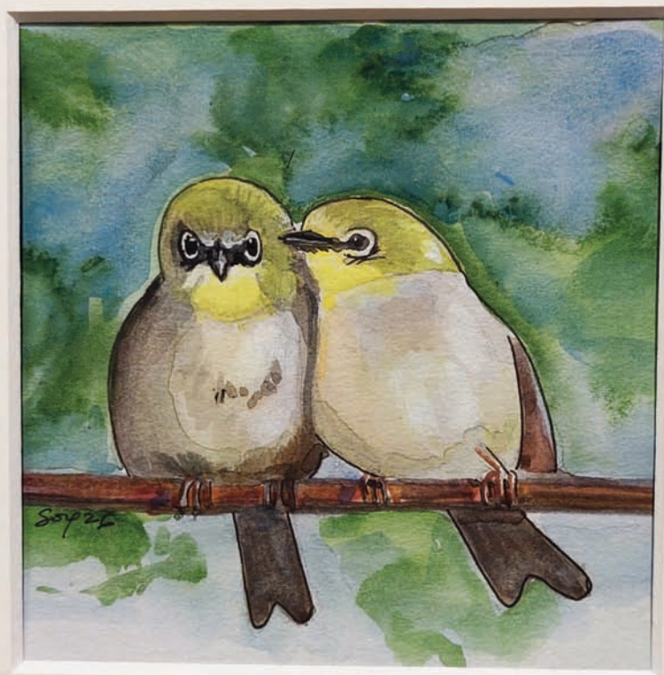
Zosterops du Japon

« Gazouillis d'amour ? » Aquarelle sur papier 12x12cm Passer partout et verre bordé kraft 20x20 cm