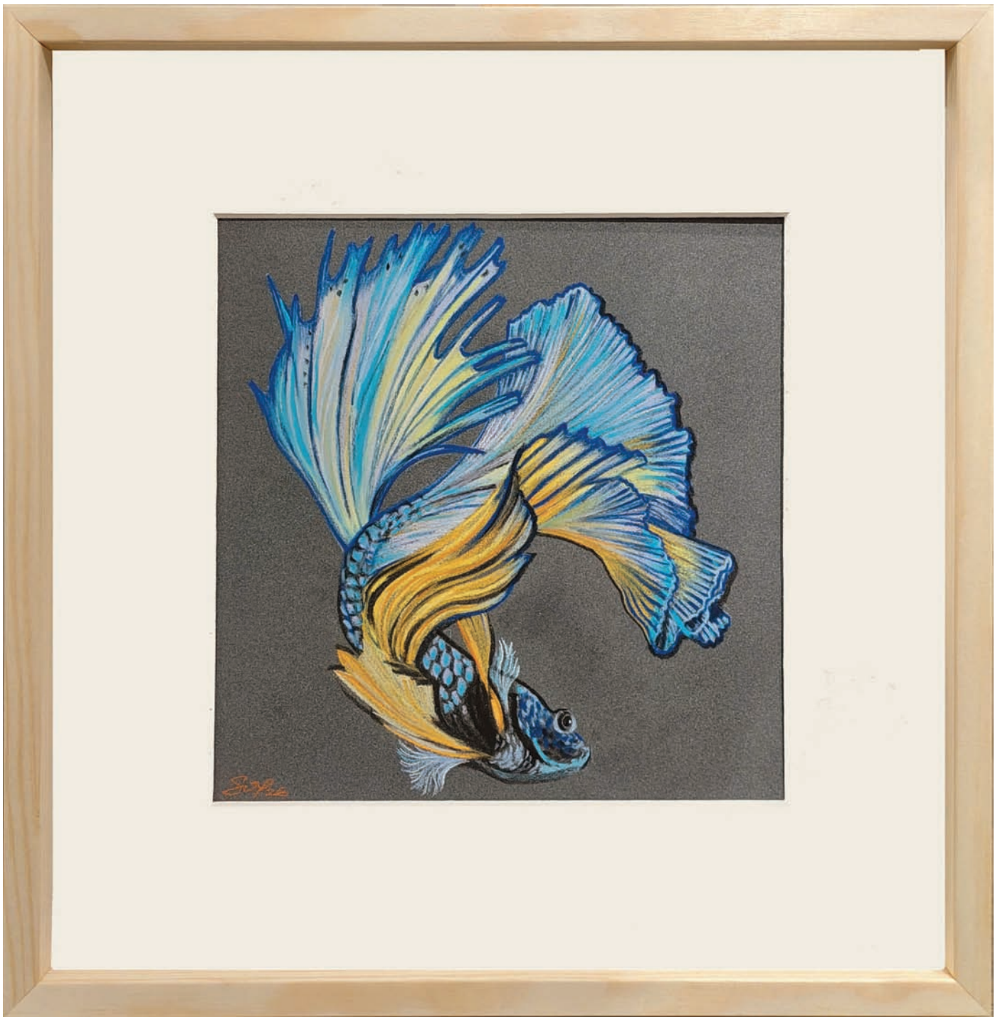
« Un beau poisson d'Avril » Pastel sec sur pastelmat 19x19 cm Passe partout et cadre bois 31,5x31,5 cm