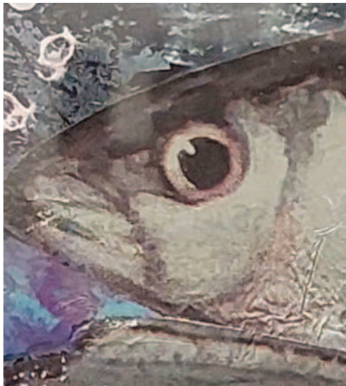
« Trois sardines inquiètes » Détail