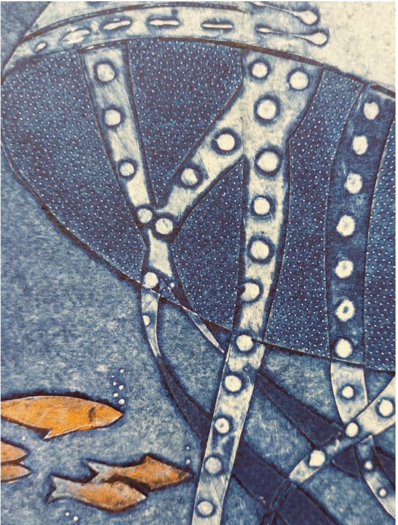
« Le rateau de la méduse » Détail