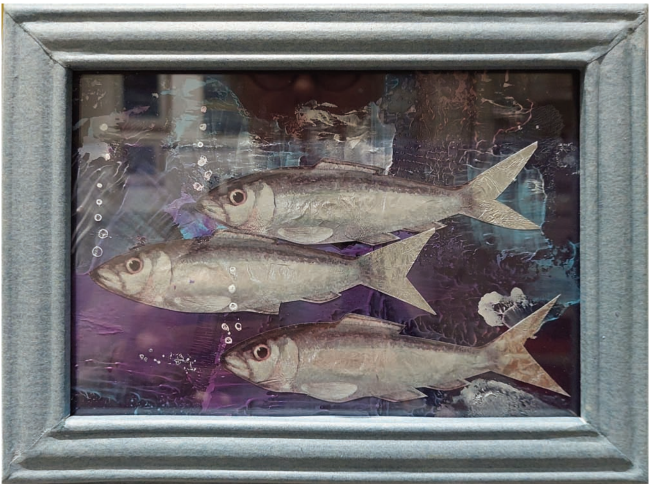
« Trois sardines inquiètes » Collage papier aluminium sur carton 13x18 cm Cadre papier marouflé 16x21 cm

38,00€ retiré à l'atelier + frais si envoi colissimo