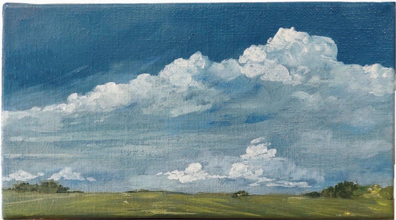
« Campagne charentaise » Huile sur toile 12 x 22 cm