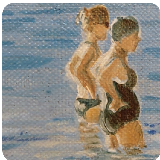
« Un après-midi de chiens » Huile sur carton toilé 20 x 20 cm Caisse américaine chêne clair 27x27 cm