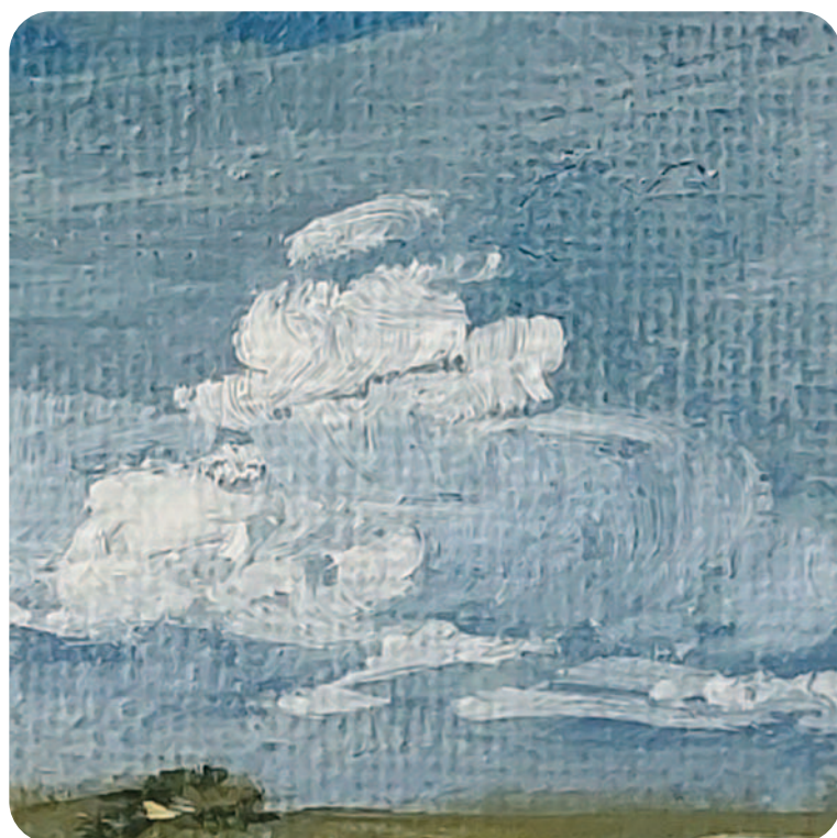
« Campagne charentaise » Détail